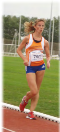
Vilaine Averous